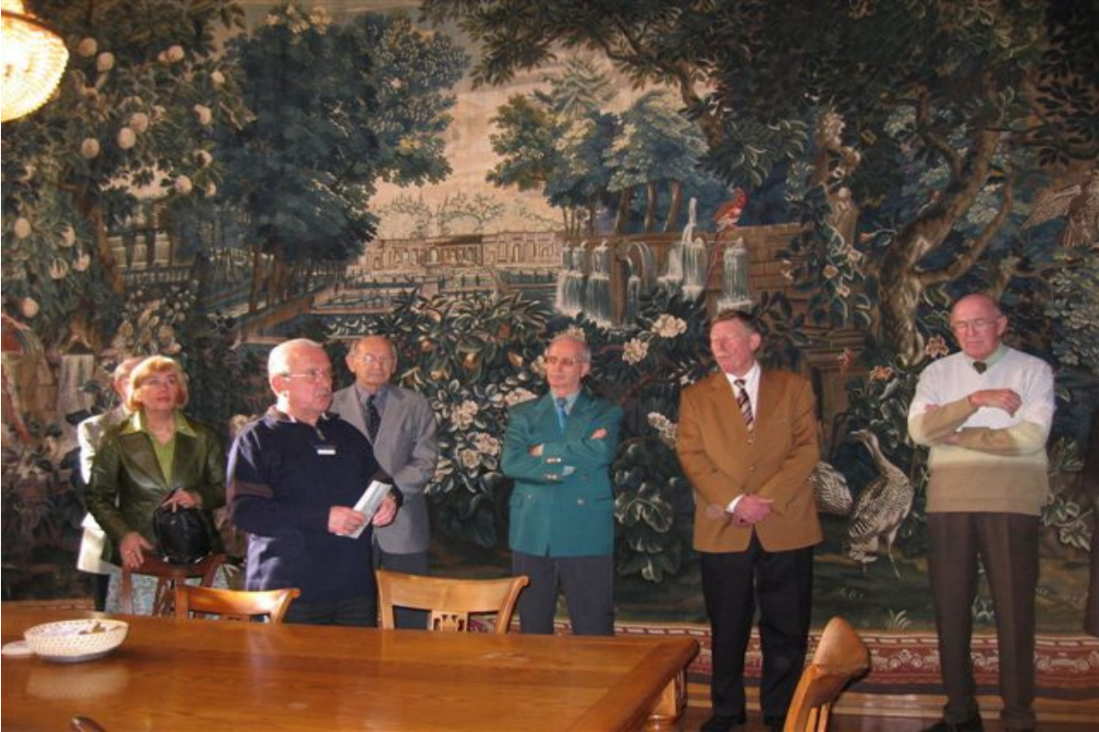
08-11-2005: De Seniorenraad op werkbezoek in Maastricht

Al deze activiteiten en contacten vergen van de Seniorenraad en zijn werkgroepen en leden een redelijk uitgebreide en continue maandelijkse evenementenagenda. Daartoe horen onder andere per jaar 10 á 11 plenaire vergaderingen en diverse werkgroepbijeenkomsten.