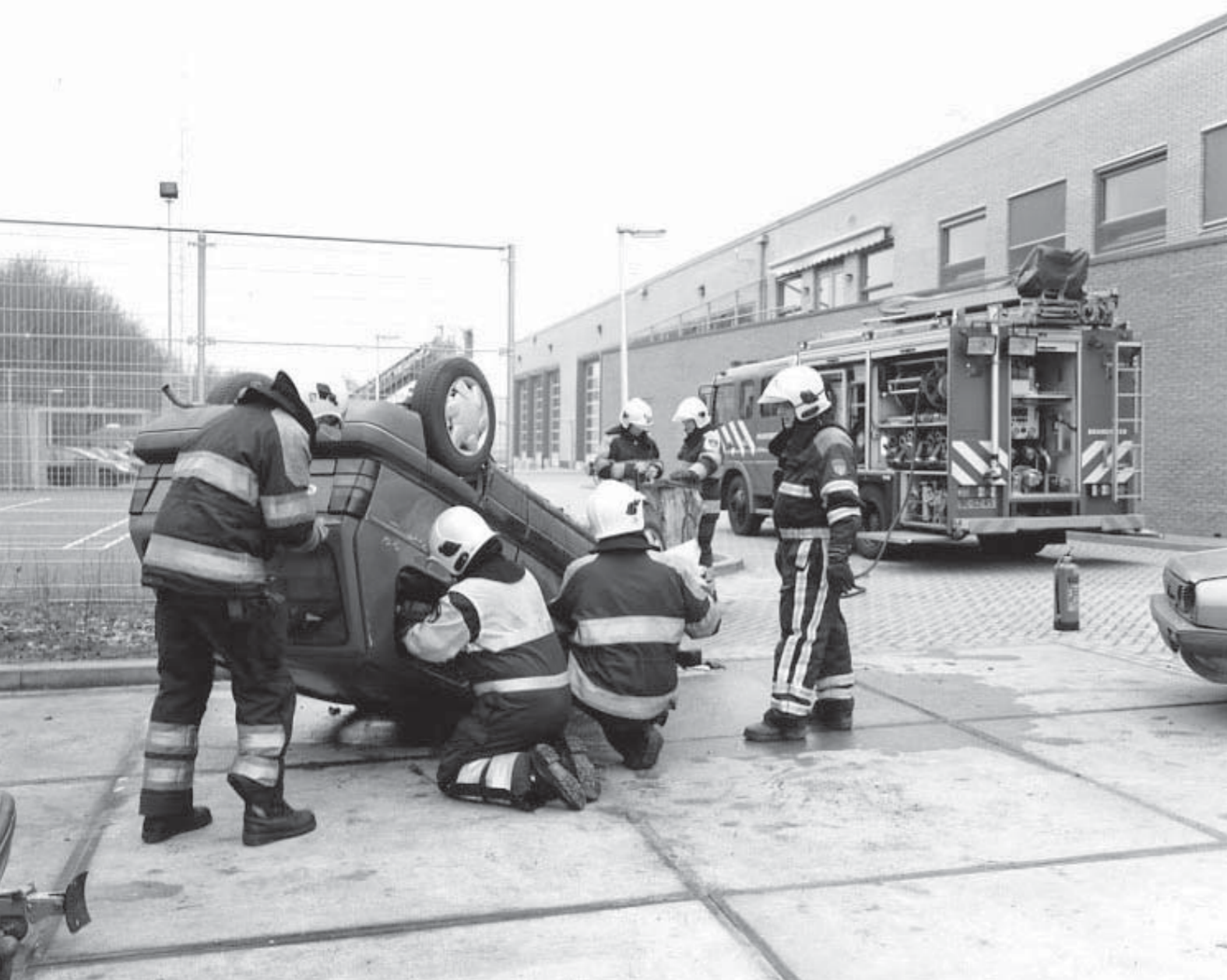
De brandweer blust niet alleen branden, maar schiet ook bij allerlei andere incidenten te hulp. Hier oefenen ze om snel en veilig in te grijpen bij een auto-ongeluk.

tot twaalf jaar. De verenigingen gaven ruim 550 gastlessen tijdens de gymuren. Hier deden in totaal meer dan 12.000 kinderen aan mee. Sportservice Nijmegen ondersteunt sportverenigingen ook bij grote evenementen voor de basisschooljeugd. Voorbeelden uit 2007 zijn: De Local Heroes Run, de mini-elfstedentocht in het Triavium, Gymnastics, het Schoolkorfbal- en Schoolbasketbaltoernooi, Taekwon'do-it' en Judocity Nijmegen. In totaal trokken de jeugdsportevenementen 2.500 leerlingen van de basisschool.