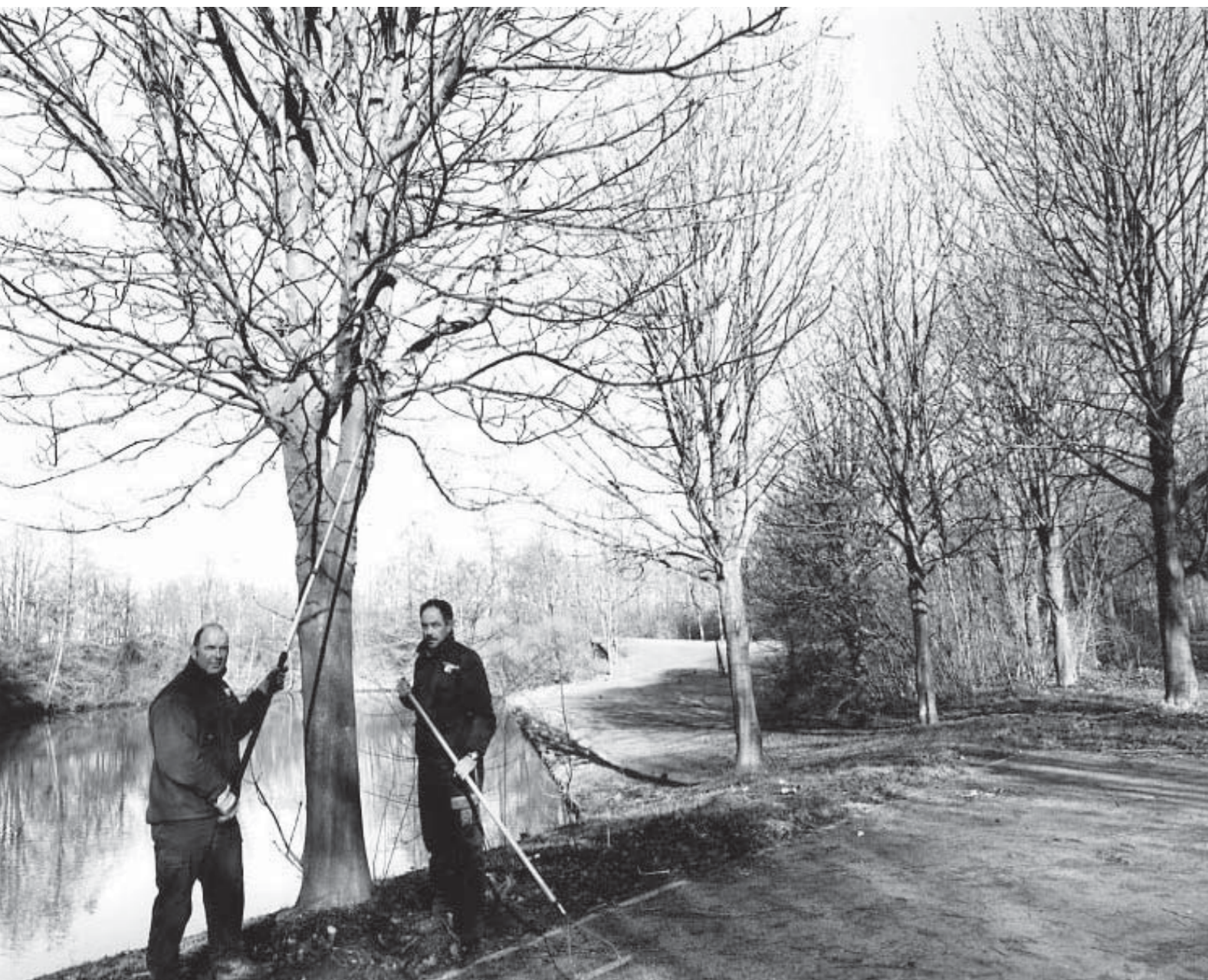
Medewerkers van de wijkserviceteams gaan aan de slag met vragen en klachten van wijkbewoners. Zij repareren bijvoorbeeld kleine beschadigingen aan het wegdek en doen kleine klussen in het openbaar groen.

De gemeente Nijmegen wil klachten voorkomen door zorgvuldig met haar burgers om te gaan. Ook bereiden we ons goed voor op nieuwe wet- en regelgeving omdat die anders tot veel nieuwe bezwaren kan leiden. De klachten en bezwaren die toch binnenkomen, krijgen een hoge prioriteit. In 2007 hebben deze aandachtspunten tot een daling van het aantal klachten geleid. Daarbij heeft de gemeente een groter deel binnen de termijn afgehandeld en zijn er minder klachten gegrond verklaard. Het niveau van 2005 is nog niet gehaald, maar we gaan wel weer de goede kant op. De cijfers over de bezwaarschriften zijn minder gunstig, de gemeente heeft juist een kleiner deel van de bezwaren binnen de termijn afgehandeld.