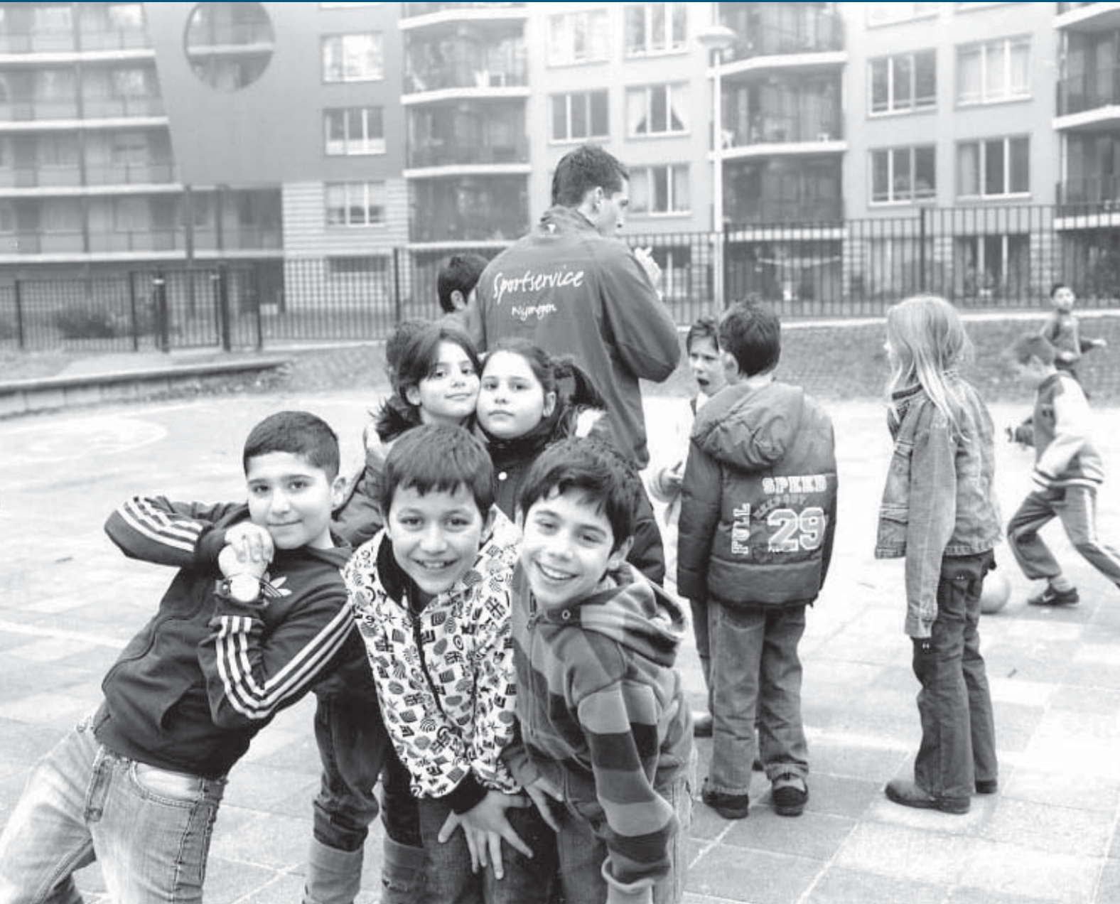
Sportdocenten van Sportservice Nijmegen organiseren dagelijks sportactiviteiten op Nijmeegse scholen en in de wijken.

Wijkbewoners werken steeds meer samen met de gemeente om de leefbaarheid in hun wijk te vergroten. Actieplannen komen in overleg met de wijkbewoners tot stand. Een mooi voorbeeld is het wijkactieplan Hatert. Hatert is door minister Vogelaar als prachtwijk aangewezen. Het actieplan is in een landelijk onderzoek tot het op één na de beste uitgeroepen. Daarbij is ook gekeken naar de aansluiting van het plan bij de wensen van de bewoners. Meer over dit actieplan leest u in het hoofdstuk Burgerparticipatie .