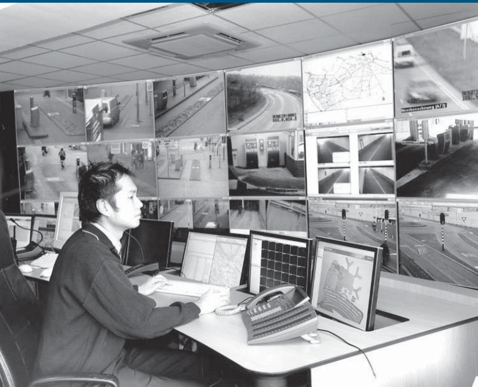
Medewerkers van de verkeersmanagementcentrale houden 24 uur per dag de roadbarrières in de binnenstad en de parkeergarages in de gaten. Alle intercomgesprekken komen in deze kamer binnen.

In 2007 had Nijmegen weer een paar grote popconcerten in het Goffertpark: de Rolling Stones, Pearl Jam, Red Hot Chili Peppers en festival BURN. Om de veiligheid bij zulke evenementen te waarborgen werkt de gemeente samen met politie, GGD en andere partijen. De gemeente coördineert het gehele traject, waardoor we ondernemers kunnen ontlasten en zelf de situatie continu goed overzien. Dezelfde werkwijze passen we toe bij de Vierdaagsefeesten. Tijdens evenementen controleert een team van handhavers ook alle vergunningen. Als niet aan de voorwaarden is voldaan, treden ze op. Zo beperken ze ondermeer de overlast voor burgers.