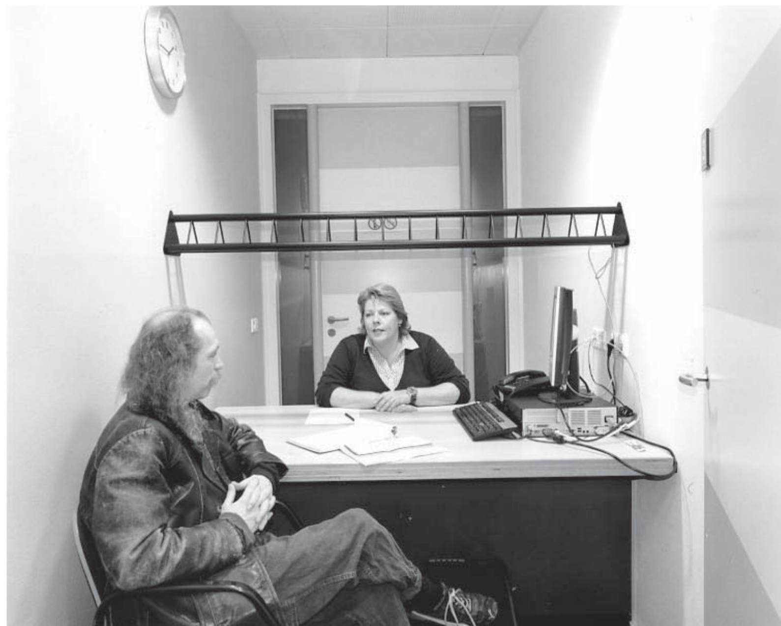
Klantmanagers van de afdeling werk en inkomen ontvangen hun klanten met een bijstandsuitkering in speciale spreekkamers.

In 2007 organiseerde Sportservice Nijmegen samen met Nijmeegse basisscholen en sportverenigingen het stimuleringsproject 'Sport jij al?' voor kinderen